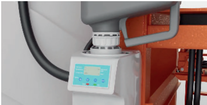
Tefen AccuRite CTS

Tefen AccuRite CTS is een digitaal systeem, dat werkt met de easyconnect doppen. De toepasser kan de doseerhoeveelheid nauwkeurig ingeven op een display/touchscreen. Vervolgens regelt het systeem de exacte hoeveelheid middel. Met een 12 V/230 V-aansluiting is de Tefen AccuRite CTS te monteren op nieuwe en bestaande veldspuiten of op een stationaire opstelling. De Accurite CTS werkt - net als bij het eerste systeem - door vacuüm leegzuigen van het fust: dit gaat snel en met weinig risico's. Met de Tefen Accurite CTS kunt u een deel van de inhoud van een verpakking doseren.