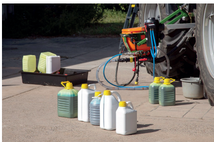
Een gesloten vulsysteem (CTS) voorkomt lekkage op het erf