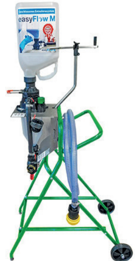
EasyFlow M. Bron: Peter Lindemann →

De grotere EasyFlow M staat los van een spuit; deze is daarom bruikbaar op de vul- en spoelplaats, voor alle op het bedrijf aanwezige spuiten. Op de Easyflow M zit een maatbeker waarin de gebruiker eerst het gewasbeschermingsmiddel doseert, voordat het via een slang in de vloeistoftank van de spuitmachine loopt. Bij de standaard EasyFlow doseert de gebruiker een middel via de maatstreepjes op de verpakking van het gewasbeschermingsmiddel en loopt het middel rechtstreeks de vloeistoftank in. Doseringscorrectie is daarbij onmogelijk.