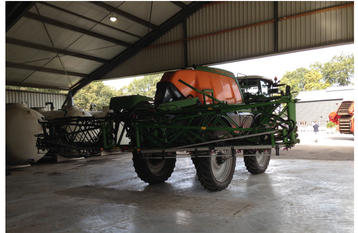
Voorbeeld van een overdekte wasplaats, alleen voor machines met gbm

Dit is de meest eenvoudige uitvoering. De wasplaats wordt alleen gebruikt voor machines met gewasbeschermingsmiddelen (gbm). Het waswater wordt via een bezinkput opgevangen in een buffer en gezuiverd met een zuiveringssysteem (zie toolboxkaart 13 over zuiveringssystemen). De grond in de bezinkput moet afgevoerd worden door een erkende verwerker. Omdat de wasplaats overdekt is, is de regelgeving over afstromend regenwater niet van toepassing.